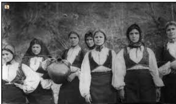
CONGRESSO CARD NAZIONALE

Si distingue dall' Istruzione perché non si limita alla mera acquisizione di conoscenze .